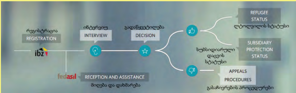
წყარო: თავშესაფარი ბელგიაში. საინფორმაციო ბროშურა თავშესაფრის მაძიებელთათვის ბელგიაში თავშესაფრის პროცედურების და მიღების შესახებ

საქართველოს მოქალაქეთა უმრავლესობა ბელგიაში თავშესაფრის მოთხოვნის საფუძვლად სამშობლოში ეკონომიკურ სიდუხჭირეს, უმუშევრობას და სხვა სოციალურ პრობლემებს ასახელებს. ძირითადად მათი თავშესაფრის მოთხოვნის განაცხადები წარუმატებელია.